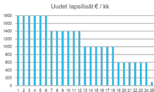
Kuvio 1: Etuudet korvaavat isommat lapsilisät kuukausittain

Lapsilisän maksatuspäivänä maksetaan kokeiluun valittujen kotitalouksien äitien tileille 1800 e/kk kuuden ensimmäisen kuukauden ajalta, seuraavat kuusi kuukautta 1400 e/kk, sitä seuraavat kuusi kuukautta 1000 e/kk ja viimeiset kuusi kuukautta ennen kuin lapsi täyttää kaksi vuotta maksetaan 600 e/kk.